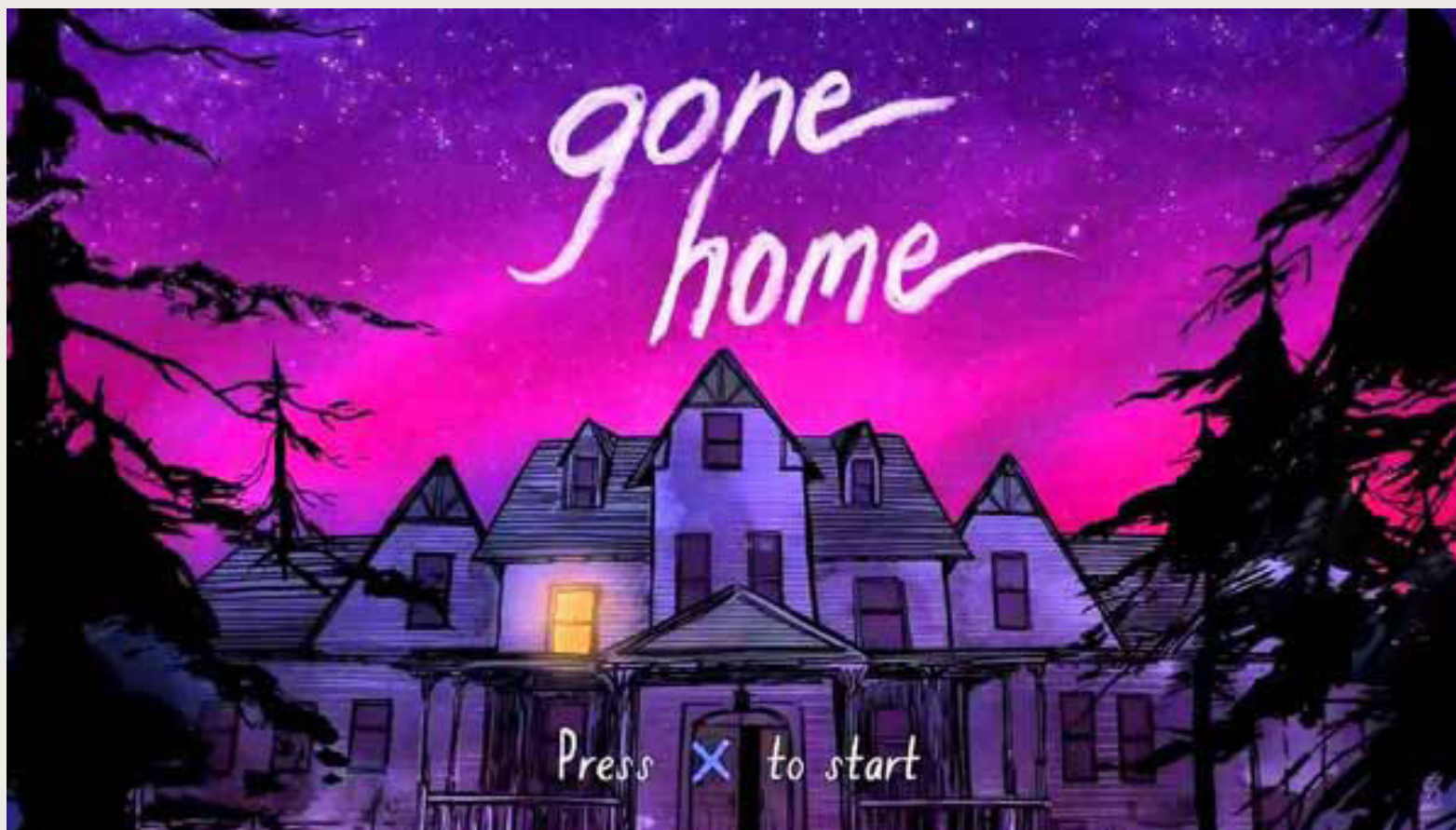
11. Žaidimo „Sugrįžus namo“ pradžios kadras

Kompiuterinis žaidimas „Sugrįžus namo“ nemokamai prieinamas projekto „Dideli maži ekranai“ dalyviams.