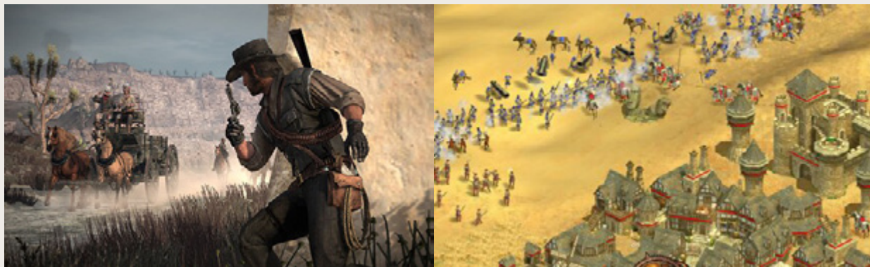
14. Skirtingos trečio asmens perspektyvos: nuotykių ir strateginiame žaidimuose

Tyrinėjimo aspektas žaidimuose – dažniausiai integrali nuotykių žaidimo žanro dalis. Nuotykių žaidimai apibrėžiami ne vienu aspektu, bet keliais sąveikaujančiais tarpusavyje. Ši sąveika kuria nuotykių žanrą, išskiria jį iš kitų. Nuotykių žanrą nusako: