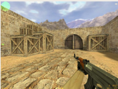
13. Pirmo asmens perspektyva šaudyklėje

Kompiuteriniuose žaidimuose įprastai išskiriami trys perspektyvos tipai: grafinė, pasakojimo (pasireiškianti dažniausiai užkadriniu balsu ) ir vaizdo . Apibrėžiant žanrus įprasčiausiai akcentuojama vaizdo perspektyva (kaip ir šio žaidimo ar pirmojo asmens šaudyklių atvejais), kuri reiškia, kaip žaidėjas matys žaidimo pasaulį. Greta pirmojo asmens yra dar dvi: antrojo ir trečiojo asmens. Antrojo asmens perspektyvoje (beje, žaidimuose pasitaikančioje rečiausiai) pagrindinis personažas matomas kito personažo akimis, trečiojo asmens – kai žaidimo herojus matomas iš šalies, žaidimo, kuriame veikia, pasaulyje. Trečiojo asmens žvilgsnio perspektyvų gali būti įvairiausių variacijų. Tyrinėjimas ir nuotyčiai