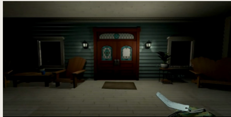
12. Žaidimo „Sugrižus namo“ išanginis kadras

Žaidimo pradžioje mes išgirstame autoatsakiklio pyptelėjimą, po kurio nuskamba balso įrašas. Iš jo sužinome, jog dukra skambina mamai ir perspėja, kad pasiimti jos nereikia, grįš pati, vėlyvą vakarą. Pirmieji žaidimo vaizdai pristato erdvę iš pirmojo asmens žvilgsnio perspektyvos : priešais save žaidėjas mato namą, gali laisvai judėti erdvėje, valdyti daiktus (judinti rankenėlę, atidaryti duris, kelti, mėtyti daiktus ir t. t.). Tai žaidėjui kuria įspūdį, jog jis veikia, mato būdamas pagrindinio herojaus „kailyje“, tarsi Kaitlin, kuri grįžo namo ir bando susivokti aplinkoje. Šis įspūdis kuriamas pasirinkto vaizdo perspektyva – pirmojo asmens žvilgsniu, tai reiškia, jog žaisdami mes žaidimo pasaulį matome tarsi herojaus akimis. Tokia pasirinkta strategija ne tik padeda susitapatinti su herojumi, bet ir diktuoja, organizuoja žaidimo pasaulio pateikimą, konstruoja jo erdvę ir elgesį joje.