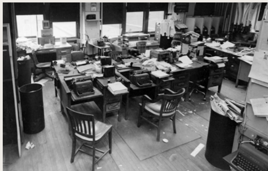
The Pittsburgh PostGazette 1960