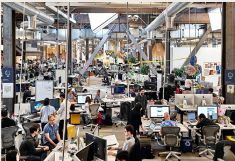
Naujienu Srauto Komandos ofisas Facebook Būstinėje. MenloPark, Kalifornija.

Vėliau pasirodanti animuota geografinės lokacijos medžiaga padeda įsivaizduoti vietovę geriau nei bet koks tekstas. Taigi kiekviena pasakojimo dalis ne tik pasirodo tinkamoje teksto vietoje, bet ir papildo, praturtina skaitytojo potyri. Jei skirtingos medijos pakartotų tai, ką skaitytojas tik ką perskaitė – tai keltų išpūdį, kad jis švaisto savo laiką.